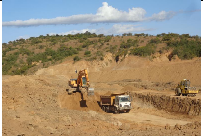
Corte en terreno, Km 35,400. San Antonio